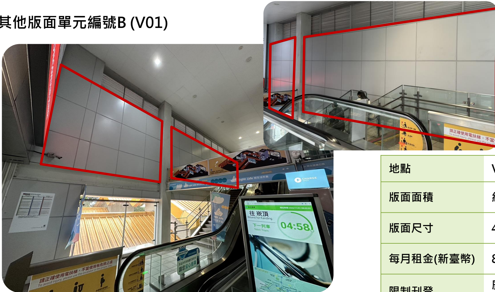
其他版面單元編號B (V01)